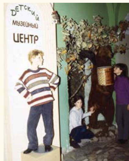
Детский музейный центр Владимиро-Суздальского музея-заповедника

ДЕТСКИЙ МУЗЕЙНЫЙ ЦЕНТР, часть музея, где сконцентрирована работа с детской и семейной аудиторией; включает