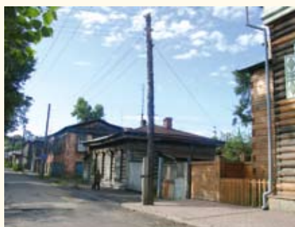
Историко-культурная среда старого Иркутска

ИСТОРИКО-КУЛЬТУРНАЯ СРЕДА , территориально-локализованное предметно-пространственное окружение человека, сочетающее в себе объекты куль-