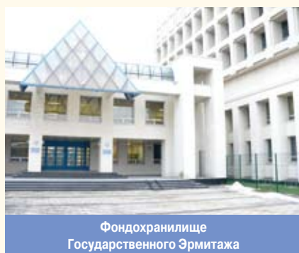
Фондохранилище Государственного Эрмитажа

ФОНДОХРАНИЛИЩЕ , помещение в музее или отдельное здание, оборудованное для хранения фондов музея . Предметы в Ф. размещаются в соответствии с принятой системой хранения и согласно действующей