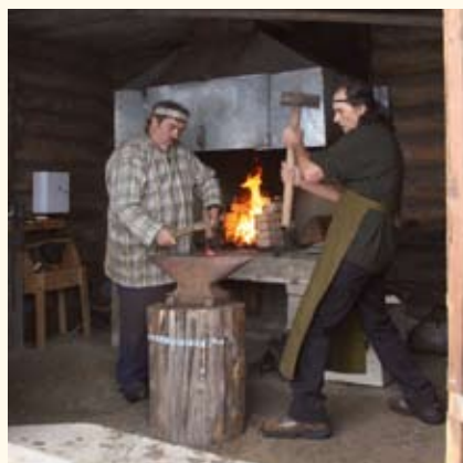
Живая экспозиция музея-заповедника «Шушенское»

ЖИВАЯ ЭКСПОЗИЦИЯ, экспозиция музейная , основу которой составляют объекты нематериального культурного наследия. Ж.э. наиболее характерны для этнографиче-