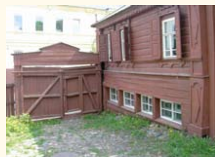
Музей детства А.М. Горького («Домик Каширина», Нижний Новгород)

МУЗЕИ-УСАДЬБЫ , группа ансамблевых музеев или средовых музеев , созданных на основе музеефикации архитектурного, ландшафтного и хозяйственного комплекса усадьбы. В кон. XX в. обозначилась тенденция к музеефикации усадьбы в ее целостности, что предполагает восстановление парка, надворных построек, малых архитектурных форм и т.п., возрождение различных видов хозяйственной деятельности (конный двор, пасеки, сады и огороды, покосы и т.п.), ревитализацию окружающего ландшафта, исторически связанного с усадьбой. Это позволяет относить многие современные М.-у. к средовым музеям и присваивать наиболее