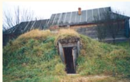
Реконструкция землянки на родине Ю.А. Гагарина в деревне Клушино. Смоленская обл.

ществлена в виде чертежа, макета, модели и других разновидностей воспроизведения музейного предмета ; в отдельных случаях создается Р. первоначального облика в