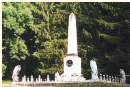
Место дуэли М.Ю. Лермонтова, Пятигорск

ДОСТОПРИМЕЧАТЕЛЬНОЕ МЕСТО, один из видов памятников истории и культуры . Термин «Д.м.» введен в ФЗ «Об объектах культурного наследия (памятниках истории и культуры) народов Российской Федерации» (2002), в котором Д.м. было выделено среди других видов памятников наряду с единичными объектами и ансамблями. Д.м. включает самые разнообразные материальные объекты, созданные человеком, а также совместные