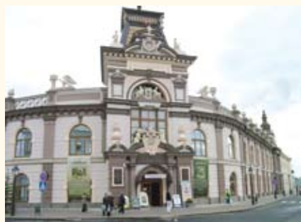
Национальный музей Республики Татарстан, Казань

ются поставленными целями – научными, административно-управленческими, юридическими и пр. В отечественном музееведении ( музеологии ) музеи подразделяются по: 1) профильным группам (см. Профиль музея ); 2) организационным типам (научно-исследовательские, научно-просветительские, учебные); 3) доминантному типу хранимого музеем наследия ( коллекционные музеи, ансамблевые музеи, средовые музеи ); 4) категориям культурной значимости (музеи федерального, регионального и местного значения; музеи – особо ценные объекты культурного наследия; музеи, входящие в Список объектов Всемирного наследия ЮНЕСКО ); 5) видам собственности – государственные музеи (федеральные, субъекта РФ), муниципальные музеи, общественные музеи, частные музеи ; 6) по правовому статусу (головные музеи, филиалы). В музееведении также используется традиционно устоявшаяся К.м. по принадлежности (государственные, муниципальные, общественные, частные, ведомственные музеи, церковные музеи ), и выделены группы музеев, обладающих специфическими признаками ( мемориальные музеи, краеведческие музеи ). Также в музейном мире функционируют учреждения музейного типа, виртуальные музеи , решающие конкретные задачи и исполняющие лишь отдельные функции музея. Рамки групп музеев достаточно подвижны; они могут изменяться в соответствии с развитием музееведения, музейной сети , форм и целей музейной деятельности.