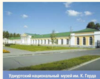
Удмуртский национальный музей им. К. Герда

БЮДЖЕТНОЕ УЧРЕЖДЕНИЕ , организационно-правовая форма учреждения культуры, деятельность которого полностью или частично финансируется собственником из соответствующего бюджета (федерального, субъекта РФ, местного или бюджета государственного внебюджетного фонда) на основе сметы доходов и расходов. Учредителем Б.у. является орган государственного/муниципального управления, который осуществляет бюджетное финансирование, предполагающее жесткую систему управления и планирования, и являющееся платой государства за социальный и экономический эффект, который проявляется за пределами сферы культуры (удовлетворение культурных потребностей граждан, вклад в развитие производительных сил). Назначенный учредителем руководитель учреждения является решающим звеном в процессе его управления. Б.у. распоряжается закрепленным за ним