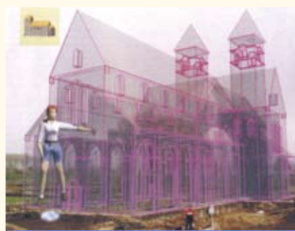
Реконструкция виртуальная церкви св. Сальватора в археологической зоне Энам. Бельгия

РЕКОНСТРУКЦИЯ ВИРТУАЛЬНАЯ , научно обоснованное восстановление внешнего облика и/или структуры утраченного, руинированного или видоизмененного памятника при помощи современных компьютерных технологий. Р.в. может осуществляться как на плоскости (изображение на мониторе компьютера), так и в реальном трехмерном пространстве с использованием современных технологий. Отличительная черта Р.в. – возможность наглядно продемонстрировать процесс соз-