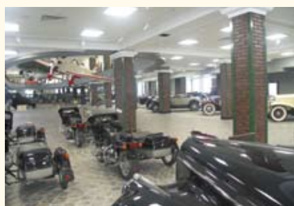
Частный музей техники В. Задорожного

ЧАСТНЫЕ МУЗЕИ , группа музеев, которые принадлежат частным лицам, созданы их усилиями и поддерживаются их средствами. Как правило, коллекции частных музеев отражают эстетические, культурные или научные интересы своих создателей