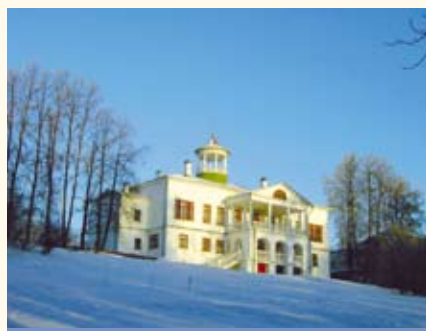
Музей-усадьба Н.А. Некрасова «Карабиха»

правления деятельности М.м. нацелены на выявление и интерпретацию этой связи. Исторический период, связанный с жизнью и деятельностью меморируемой личности, принимается за «оптимальную дату», с учетом которой проводится реставрация и реконструкция , восстановление интерьеров и т.п. Профиль музея определяется сферой деятельности, в которой проявила себя меморируемая личность; наиболее многочисленны в РФ мемориальные литературные музеи. Среди М.м. преобладают дома-музеи , музеи-усадьбы , музеи-квартиры, музеи-мастерские. В последние десятилетия XX в. в связи с тенденцией к комплексному сохранению среды многие М.м. стали многопрофильными и получили статус музеев-заповедников .