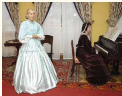
Театрализованная экскурсия в музее П.И. Чайковского в Воткинске

ФАНДРАЙЗИНГ (англ. fundraising), деятельность некоммерческих организаций по привлечению ресурсов и финансовых средств для осуществления социально значимых проектов. К ресурсам, которые обеспечивают волонтерство , информационное спонсорство и т.д., относятся время, товары, услуги и др. Источниками финансирования могут являться государственный бюджет, средства коммерческих организаций, фондов, частных лиц. В музейном деле специфическими источниками являются пожертвования и членские взносы обществ друзей музеев , меценатство . Ф. является частью музейной политики , включается в план развития музея (см. Планирование в музейном деле ).