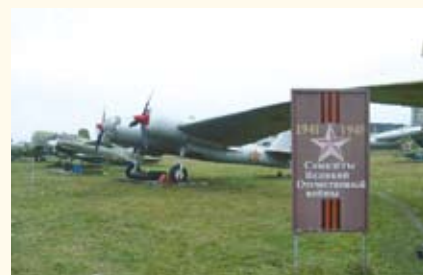
Музей ВВС в Монино Московской обл.

КЛАССИФИКАЦИЯ МУЗЕЕВ , изучение и группировка музеев по определенным организационным, правовым и содержательным признакам. Принципы К.м. определя-