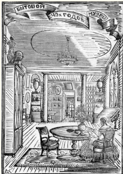
Музей дворянского быта 40-х гг. Путеводитель

МУЗЕОГРАФИЯ (от гр. museion – музей, и grapho – пишу), корпус изданий о музее, характеризующий все или одно из направлений деятельности музея или му-