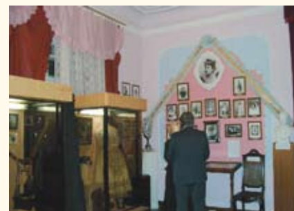
Музей-театр в Кисловодске

ПАРАМУЗЕИ , в зарубежной музеологии – учреждения музейного типа , хранящие и экспонирующие не подлинные музейные предметы , но воспроизведения музейных предметов (объектов) или объекты, специально созданные для иллюстрирования исторических событий и явлений: восковые фигуры, высококачественные репродукции произведений искусства, предметные комплексы, новоделы и т.п.