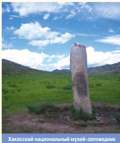
Хакасский национальный музей-заповедник

КУЛЬТУРНОЕ И ПРИРОДНОЕ НАСЛЕДИЕ , совокупность объектов культуры и природы, отражающих этапы развития общества и природы и осознаваемых социумом как ценности, подлежащие со-