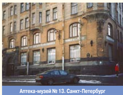
Аптека-музей № 13. Санкт-Петербург

УЧРЕЖДЕНИЯ МУЗЕЙНОГО ТИПА , учреждения, исполняющие отдельные функции музея и практикующие некоторые свойственные музеям формы деятельности. У.м.т. могут формироваться путем соединения двух (иногда и более) учреждений в одном; приобретения учреждением отдельных черт музея, не свойственных ему изначально; расширения музеем сферы нетрадиционных форм работы. К кон. XX в. сформировались различные виды У.м.т.: детские музеи , музей-театр, музей-аптека, музей-ресторан, музей-клуб, библиотека-музей, школа-музей, экономузей и др. У.м.т., сохраняющие нематериальное культурное наследие , как правило, называются живыми музеями .