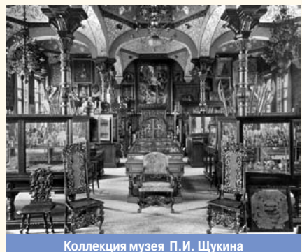
Коллекция музея П.И. Щукина

КОЛЛЕКЦИОНИРОВАНИЕ , процесс целенаправленного собирания различных артефактов и природных объектов. В отличие от собирательства характеризуется четко