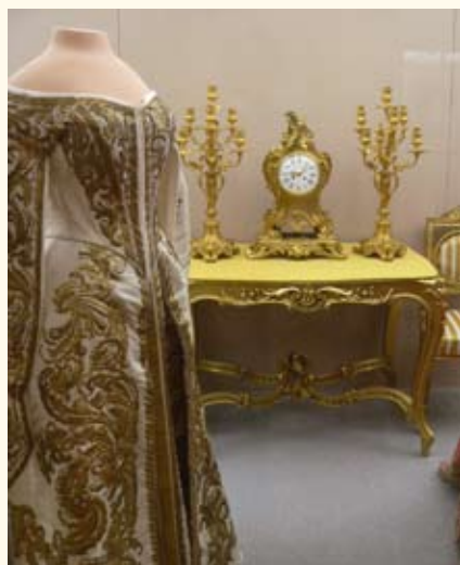
Выставка костюма. Музей-заповедник «Павловск»

сов различных целевых аудиторий музея , расширения коммуникативных возможностей музея . В. повышают эффективность использования коллекций музея , делают доступными для публики коллекции других музейных и частных собраний (см. Собрание музейное ), позволяют выносить на обсуждение актуальные, в т.ч. социальные, проблемы, представлять новые исследования в профильных науках. В. различаются по месту проведения (внутримузейные, внемузейные, межмузейные, передвижные), по содержательным признакам (тематические, проблемные, фондовые, отчетные, персональные, юбилейные и др.). Разновидностью являются постоянно действующие В., дополняющие либо замещающие основную экспозицию музея. В. могут становиться творческой лабораторией музея.