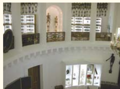
Анатомический театр Казанского государственного университета

ПРОТОМУЗЕЙНЫЕ ФОРМЫ , культурные образования (арсеналы, великокняжеские сокровищницы, церковные ризницы, аптеки и пр.), наряду с утилитарными функциями выполнявшие задачу поддержания культурной памяти (собирания и хра-