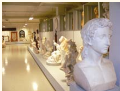
Открытое хранение фондов в Государственном Эрмитаже

ОТКРЫТОЕ ХРАНЕНИЕ , форма хранения и актуализации фондов музея , позволяющая расширить доступ посетителей к наследию. В целях обеспечения сохранности фондов музея О.х. должно осу-