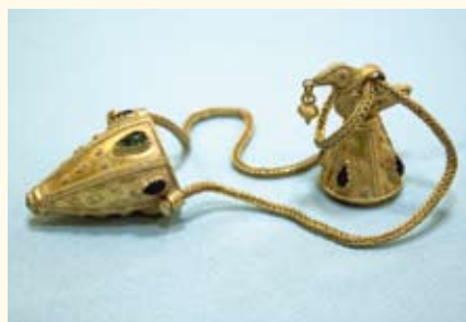
Бальзамарий из раскопок близ г. Сочи

эстетические идеалы, нормы поведения, языки и диалекты, традиции, исторические топонимы, фольклор, художественные промыслы и ремесла, произведения искусства, уникальные историко-культурные и природные территории , сооружения, технологии, результаты и методы научных исследований культурной деятельности, имеющие историко-культурную значимость и др. Государство обязано обеспечить неотъемлемое право доступа к ним каждого гражданина РФ. Понятие К.ц. определено в Основах законодательства РФ о культуре, законе РФ «О вывозе и ввозе культурных ценностей» (1993).